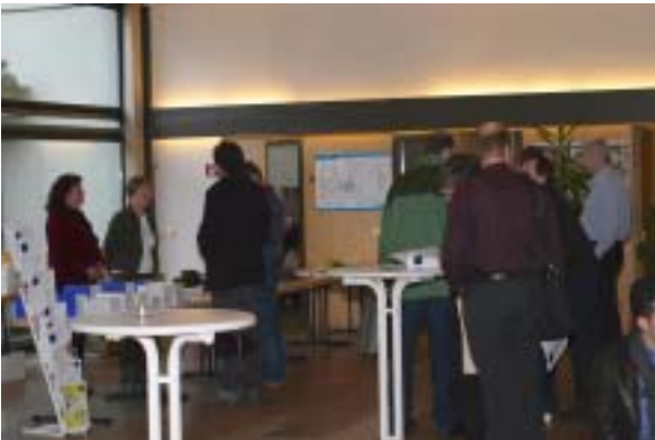
Bild 1: Tagungsbüro im Foyer

Vom 19. bis 21. November 2003 fand im Hörsaal des Max-Planck-Instituts für biophysikalische Chemie das von der GWDG vor Ort organisierte 20. DV-Treffen der Max-Planck-Institute statt. Dieses jährliche Treffen führt Datenverarbeitungsfachleute aus den Max-Planck-Instituten ganz Deutschlands zusammen, um Erfahrungen auszutauschen und aktuelle Probleme der wissenschaftlichen Datenverarbeitung zu diskutieren.